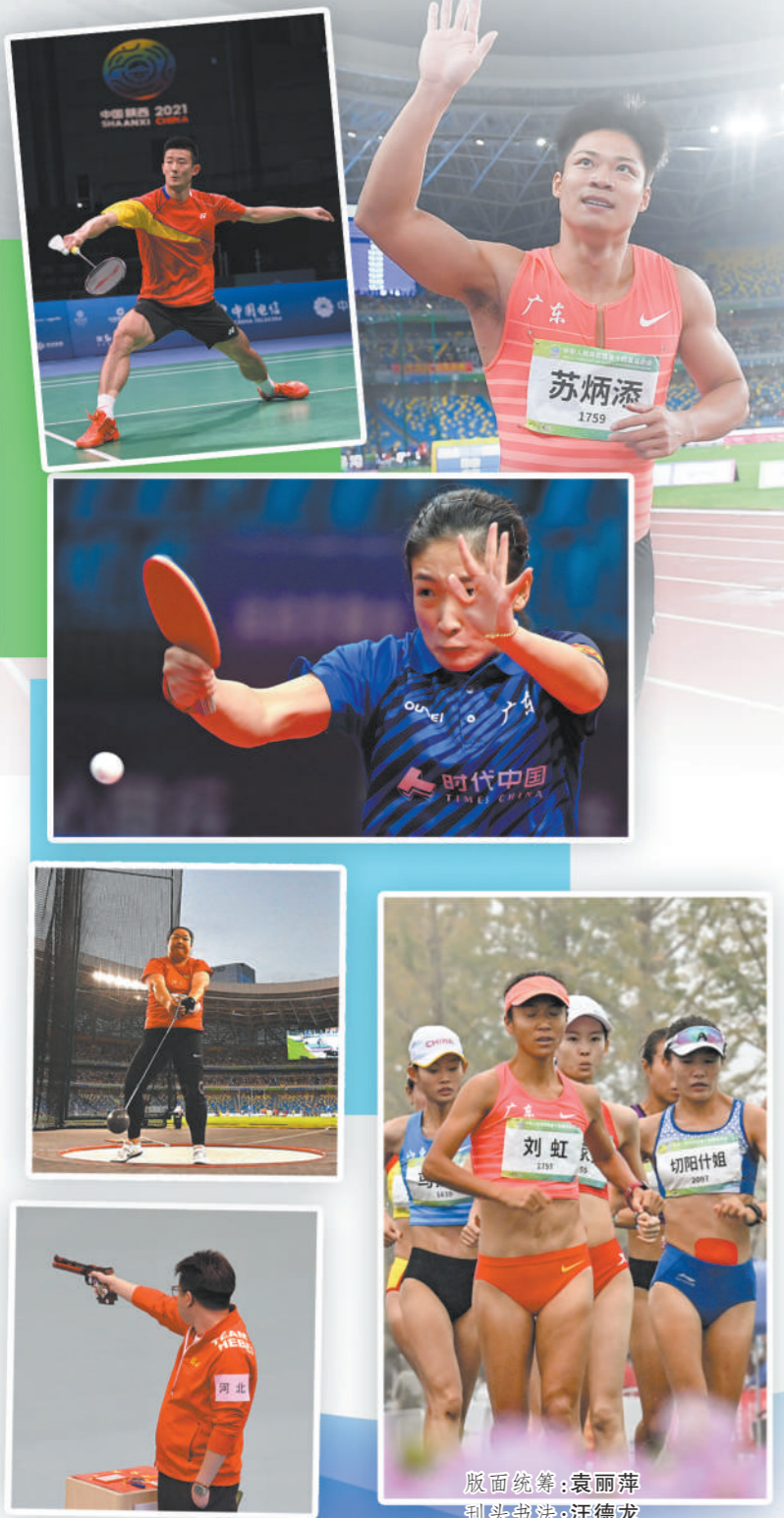
版面统筹：袁丽萍 刊头书法：汪德龙 版式设计：贾国梁、郭子涵

全民全运、同心同行。中国体育事业既要有在竞技赛场上呈现精彩比赛的运动员，也需要默默坚守在幕后的教练员。其实，其他行业很多时候亦是如此，只有台前、幕后紧密团结、共同努力，才能赢得更大的胜利。